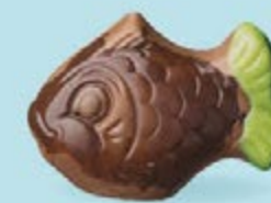
Praliné et noix de coco caramélisée