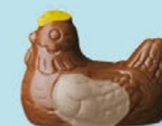
Duo praliné et ganache caramel