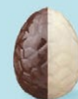
Praliné avec éclats de noisettes