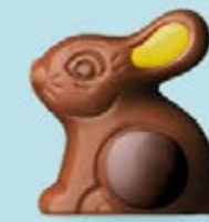
Praliné et riz soufflé