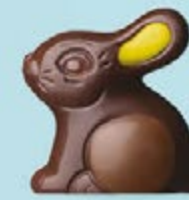
Praliné et éclats d'amandes caramélisées