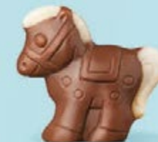
Praliné croustillant aux éclats de crêpe dentelle